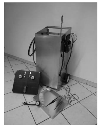
Start Free mit diversem Zubehör