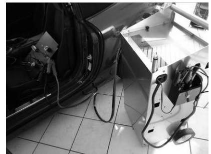
Bestens geeignet für Diagnosen